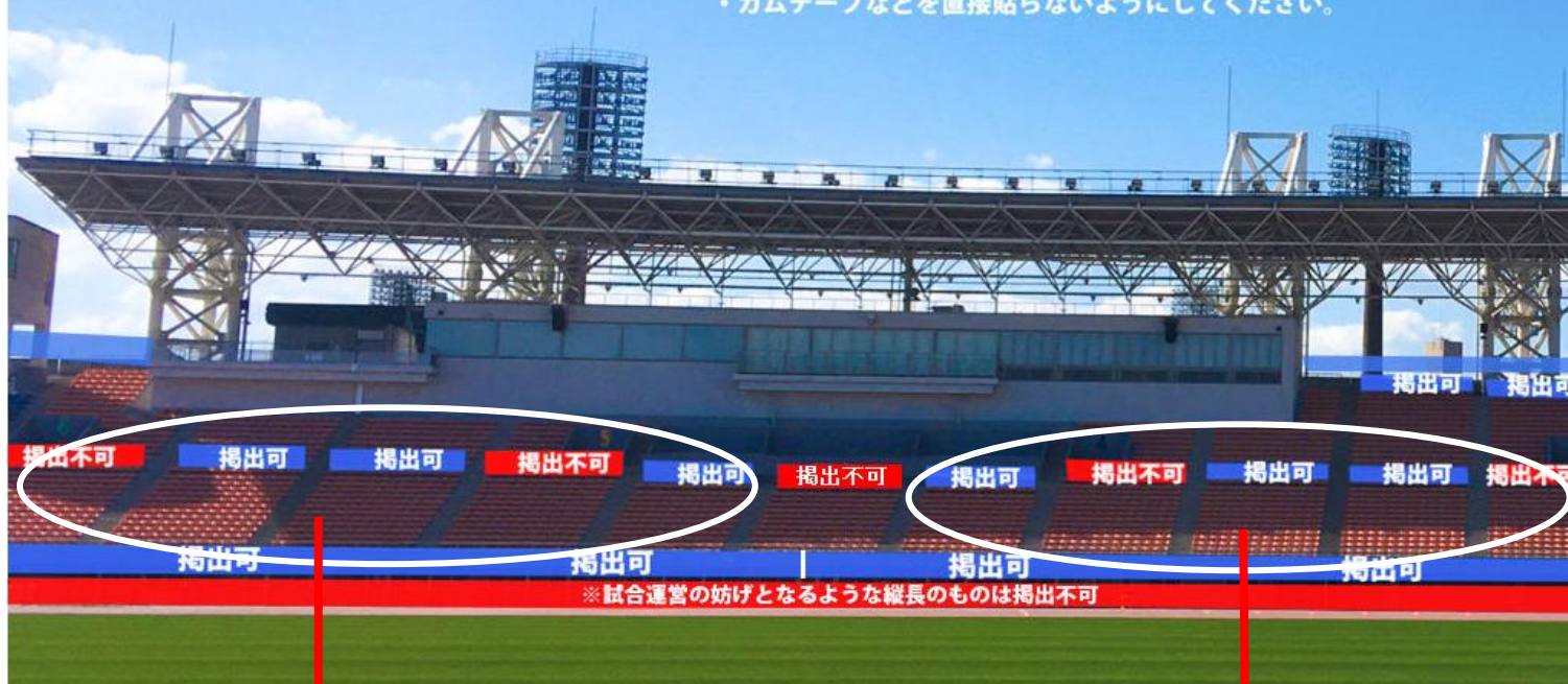
鹿屋体育大学 横断幕掲出エリア